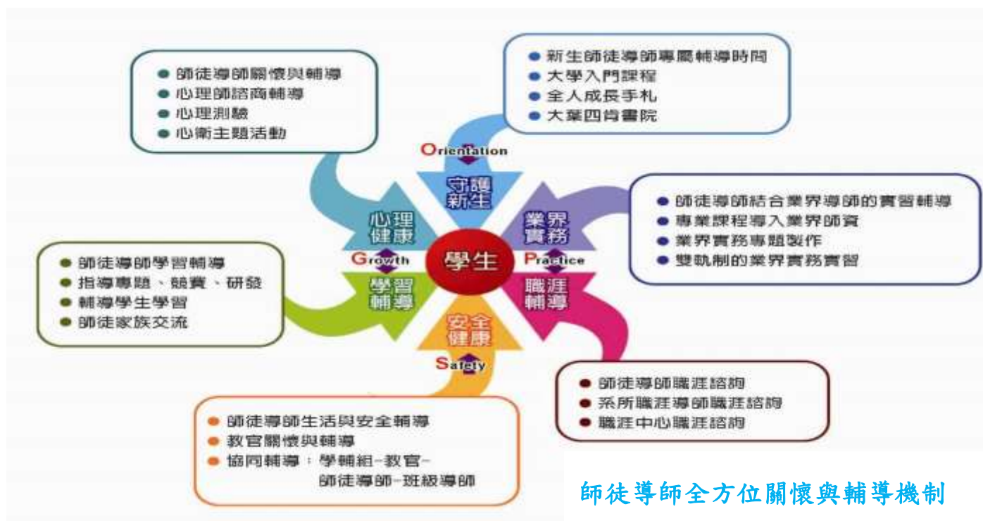
師徒導師全方位關懷與輔導機制

本校學生大多較缺乏學習自信和動機，更需要老師的關懷與輔導。因此教學卓越計畫依創校之「師徒制」理念，建立「師徒導師全方位關懷與輔導機制」。