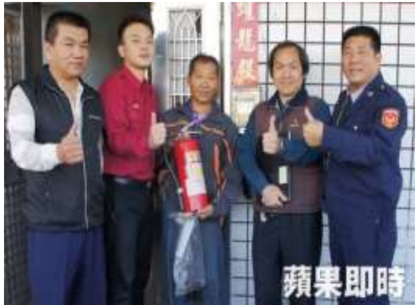
本校與警消人員至學生校外租屋處進行檢核

校長表示：本校以彰化縣政府的租屋安全認證標準，協同警消人員對學生的租屋處做安全檢查，期讓每位學生都住的安全有保障。