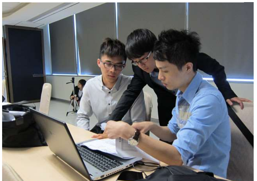
本校工工系易同學參加102年工工學會大專生專題競賽(2013/6/7)